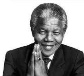
Nelson Mandela 1918-2013